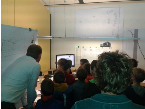
“Kinderen van groep 6 ondervinden hoe het werkt bij Bouwbedrijf Lont.”