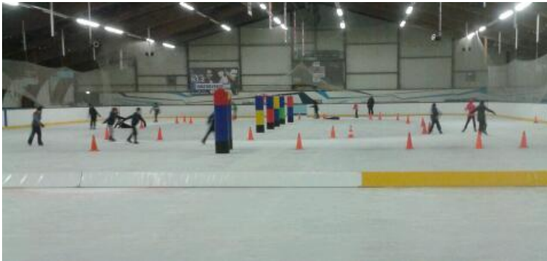
“Geen winter, maar wel schaatsen voor kinderen groep 5.”

De kinderen vinden het jammer dat de wekelijkse trip naar de ijshal er op zit. Ze hebben veel geleerd en volop genoten. Kortom: het was een groot succes.