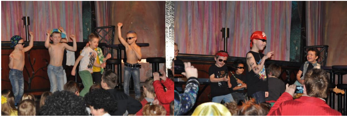
”Voetbaljeugd laat zich van zijn beste kanten zien”

naar huis kan nemen. Dit alles even als voorbeschouwing op deze zinderende avond die in een uitstekend voetbalsfeertje zou gaan verlopen! Het thema Boy of Girlband, of zelfs een combinatie daarvan, was uitstekend gekozen en zorgde voor een grote diversiteit van acts. Daar waren ondermeer van de allerjongsten, de zogenoemde “Kaboutertjes”, de AVICI act dat werd uitgevoerd met een bravoure van ongekenne allure. Ook the Spicegirls, The Jackson Five, Hot Chelle Rae en “Vuur en Vlam” van respectievelijk de E3, E4, F1 en de F2 tilden de avond naar een ongekend niveau!