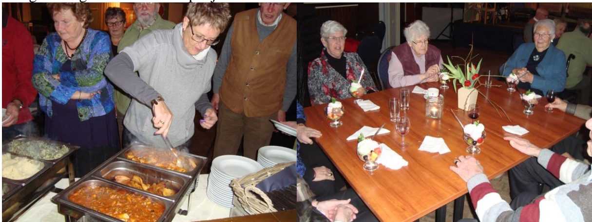
"Het nieuwe jaar zet met buffet goed in voor de ouderen van de ANBO"

Het buffet bestond uit pasta, zuurkool- en boerenkoolstampot met worst, spekjes en speklapjes. Er werd smakelijk van gegeten en er was meer dan genoeg voor iedereen. Tot slot kreeg elk nog een lekkere coupe ijs.