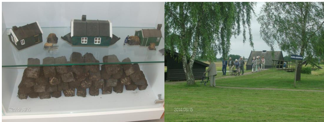
“Leden PCOB mei reiske nei Damshûs”.