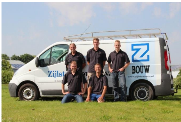
"Na 25 jaar gaat Bouwbedrijf Zijlstra over van vader op zoon".